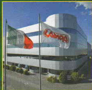
I TRAGUARDI DI LAMPA