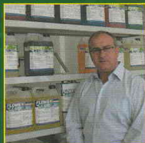
FILIPP FLORIO DI FLOWEY