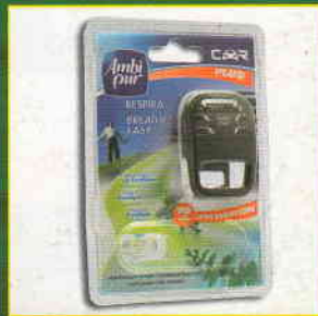
TECNOLOGIE E FRAGRANZE CORA