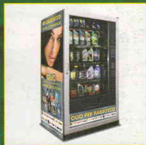
IL SUCCESSO DI IORABOCCO