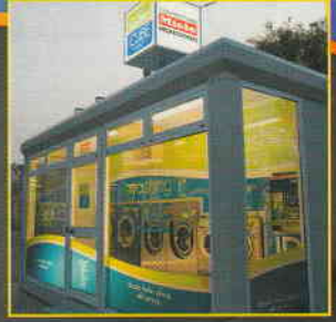
WASHING CUBE LAVANDERIA BUSINESS