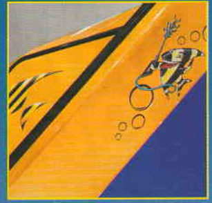
AQUARAMA BUBBLES BAY