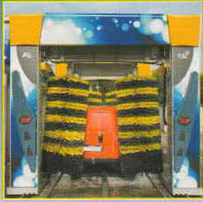
AUTOEQUIP IN EMILIA ROMAGNA