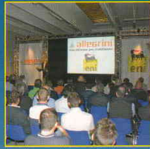
ENI R&M SCEGLIE ALLEGRI