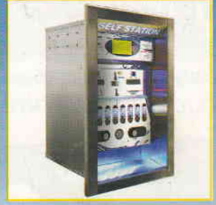
PAYTEC PAY MONITORING