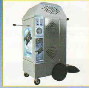
FRA-BER TUTTO PIU' FACILE